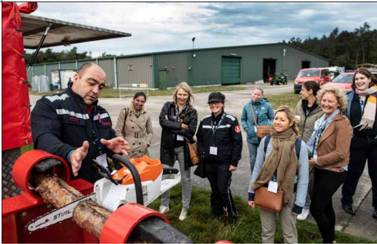
Op het terrein rondom het gebouw werden workshops gegeven, van brandbestrijding tot boomzaagtechnieken.

H et tweedaags evenement vond dit jaar plaats op de terreinen van de hulpverleningszone Taxandria in de Noorderkempen. Het depot in Ravels bood plaats aan meer dan vijftig leveranciers en stakeholders uit de sector. Bij het grote podium achteraan konden bezoekers panelgesprekken en lezingen bijwonen, en op het terrein rondom het gebouw werden workshops gegeven, van brandbestrijding tot boomzaagtechnieken.