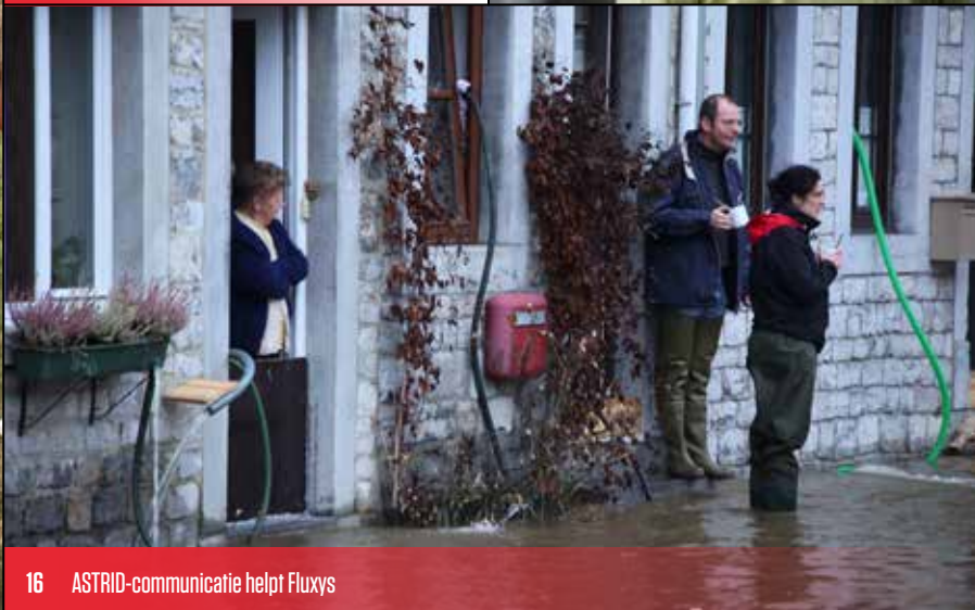
16 ASTRID-communicatie helpt Fluxys